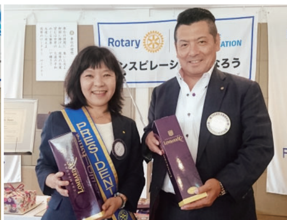
結婚記念日の水庫会長と大原会員